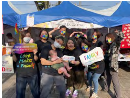
一般社団法人こどもまっふ