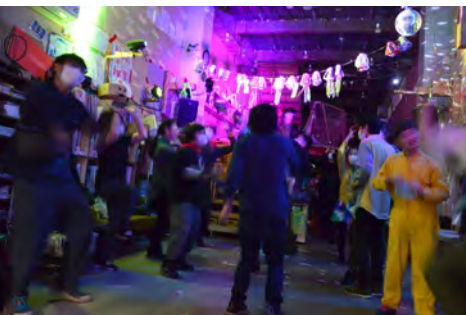
認定NPO法人クリエイティブサポートレッツ