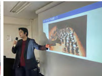
アーツカウンシルの視点