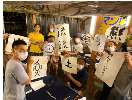
NPO法人コクルーム・釜ヶ崎芸術大学