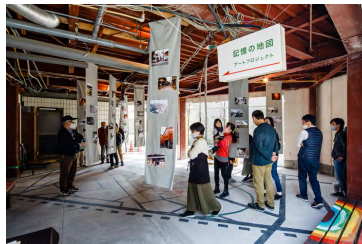
“記憶の地図”を巡るアートプロジェクト