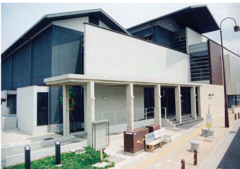
地域に根ざした美術館をつくること